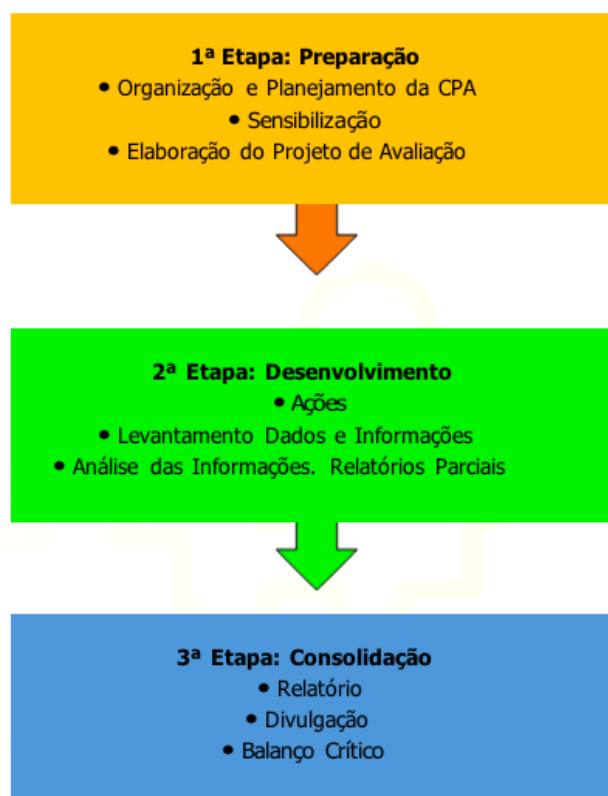
Figura 01: Etapas do processo de autoavaliação Institucional CPA – Unochapecó.