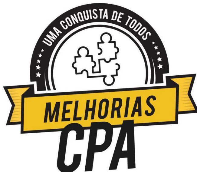
Figura 3 Selo da CPA.